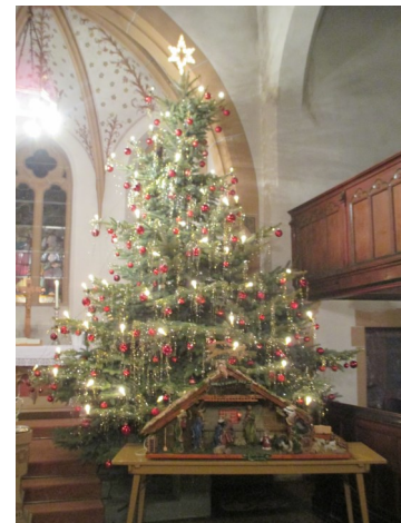
Text/Foto: Pfr. K. Kaltwasser

WÖBAU GmbH & Co. KG STRASSEN-, TIEF- UND HOCHBAU