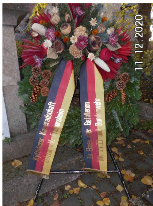
Text/Fotos: Dieter Stroekens